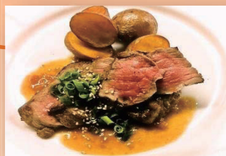
ミニッツステーキ