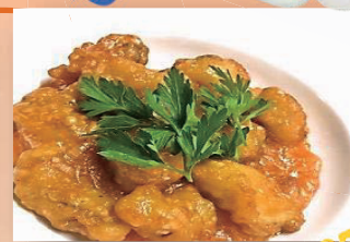
白身魚のチリソース