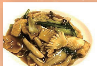
五目あんかけ焼きそば