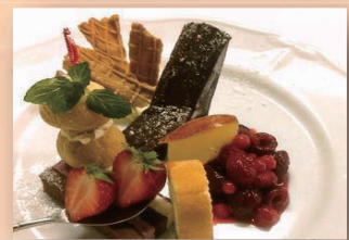
アイスとデザート フルーツの盛合せ