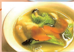
貝たくさん水餃子