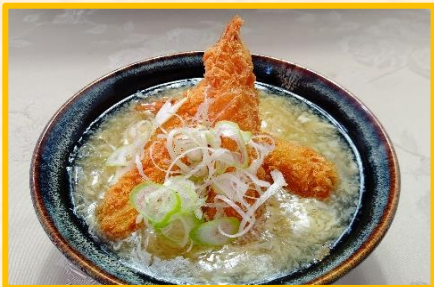
海老フライ入りあんかけ稲庭うどん