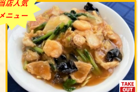
五目あんかけ焼きそば