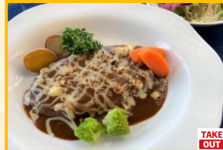
チーズハンバーグステーキ