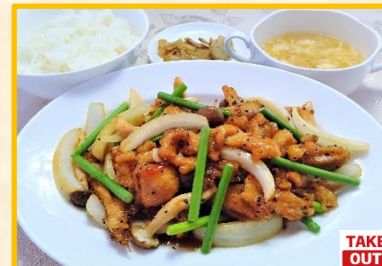
鶏肉のブラックペッパー炒め