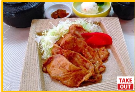
豚肉生姜焼き定食