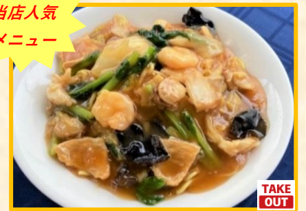
五目あんかけ焼きそば