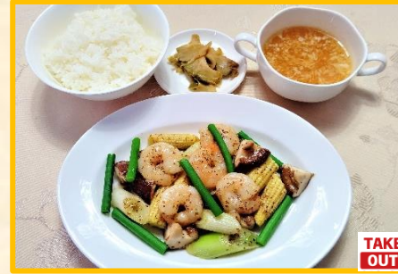
海老マスタード炒め