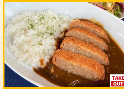
メンチカツカレー