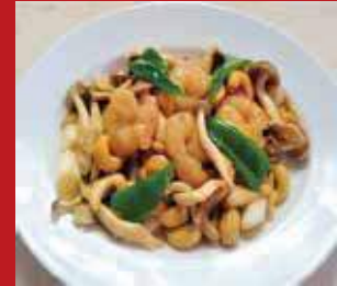
◎海老とカシューナッツの炒め