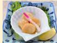
帆立貝バター焼き