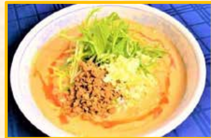
担 々 麵