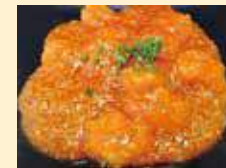
海老のチリソース煮