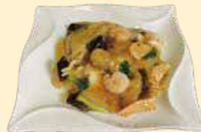
五目あんかけ焼きそば