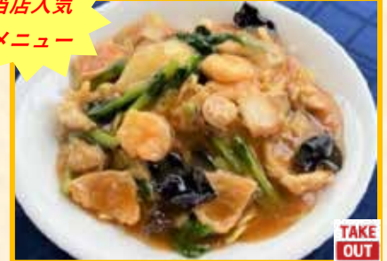
五目あんかけ焼きそば