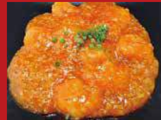
◎海老のチリソース煮