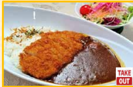
ポークカツカレー