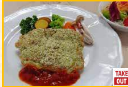
チキンの香草パン粉焼き