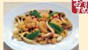
海老とカシューナッツの炒め