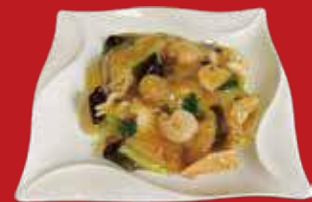
◎五目あんかけ焼きそば