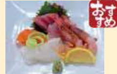
刺身4種盛り合わせ