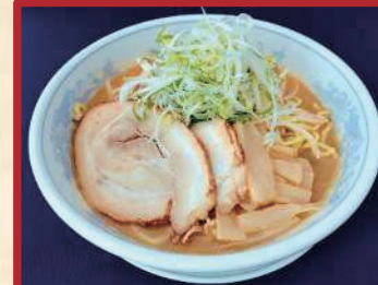
味噌ラーメン ¥ 800