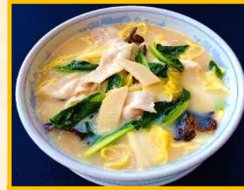
豚バラ肉と野菜の ちゃんぽん麺 ¥ 800