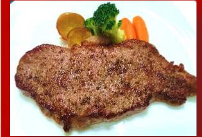
ミニッツステーキ 温野菜添え ライス・サラダ付 ¥1,500