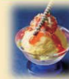
アイスクリーム 300円