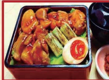
鶏ステーキ重 味噌汁・漬物付 ¥ 900