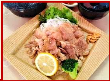
牛肉塩たれ焼き定食 ご飯・味噌汁・漬物付 ¥ 1,200