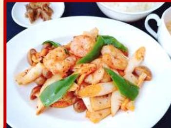
海老の麻辣炒め ご飯・小付・スープ・ザーサイ付 ¥ 1,000