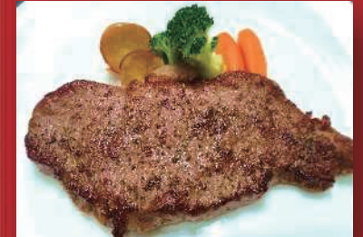
ミニッツステーキ 温野菜添え ライス・サラダ付 ¥1,500