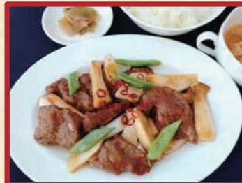
牛肉の辛し炒め ご飯・小付・スープ・ザーサイ付 ¥ 1,000