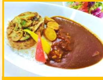
ハンバーグカレー サラダ付 ¥ 900