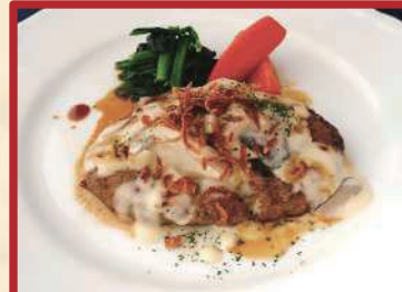
ハンバーグステーキ きのこクリームソース ライス・サラダ付 ¥ 1,100