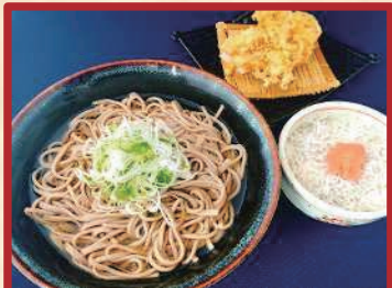
かき揚げ蕎麦 しらす鱧子丼 ¥ 1,000