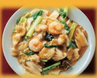
五目あんかけ焼きそば ¥1,200 ※御飯に変更可