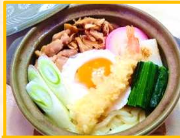
鍋焼きうどん ¥ 900