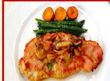
三元豚ロース サルティンボッカ風 ライス・サラダ付 ¥ 1,100