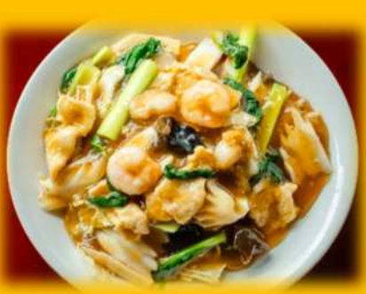
五目あんかけ焼きそば ¥1,200 ※御飯に変更可